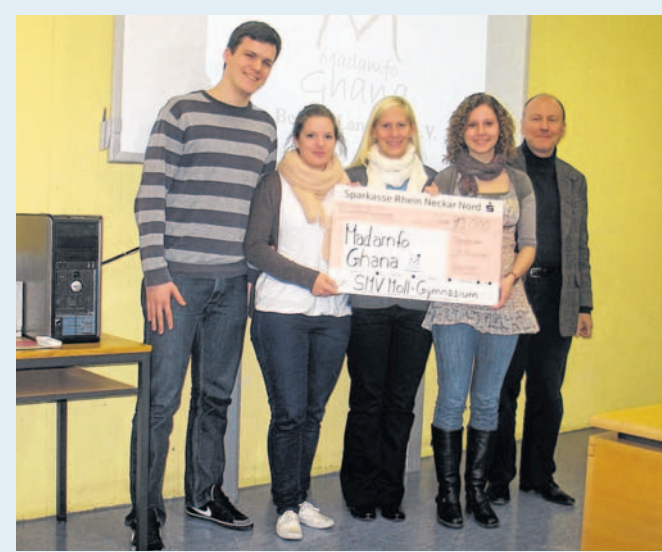
Schon im vergangenen Jahr konnten Schüler des Moll-Gymnasiums eine Spende an den Verein „Madamfo Ghana“ überreichen. Beim Osterflohmacht soll jetzt wieder Geld gesammelt werden.

Die musikalische Umrahmung wird seitens der Schulband des Moll-Gymnasiums gestaltet. Der Erlös kommt dem Hilfsverein „Madamfo Ghana“ in Afrika zugute. imp