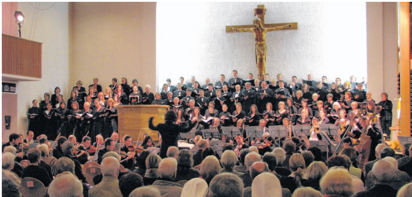
Leckerbissen für Klassik-Fans: Für das Konzert „Carmina Burana“ am 8. Mai werden 3 mal 2 Karten verlost.

Beim gemeinsamen Probenstag wird Carl Orffs Meisterwerk „Carmina Burana“ der letzte Schliff verliehen und am Sonntag, 8. Mai, als Höhepunkt