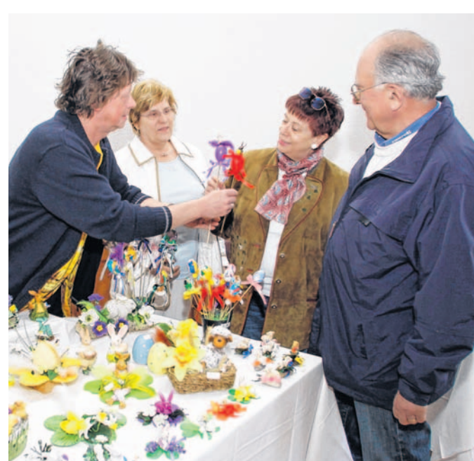
Ein wichtiger Kommunikationspunkt im Stadtteil: Der Ostermarkt im Richard-Böttger-Heim hat auf dem Lindenhof Tradition.

Bei der Eröffnung bot das Heim 66 Zweizimmerwohnungen und 29 Einzimmerwohnungen mit Kochraum, also insgesamt Wohnraum für 161 Wohnungen. Daneben hatte man noch eine „Pfleglingsabteilung“ eingerichtet, während die Selbstversorger ihre Räume selbst möblierten. Damals stand für jede Wohneinheit ein abschließbarer Kellerraum zur Verfügung sowie eine eingerichtete Waschküche mit Trocken- und Bügel-