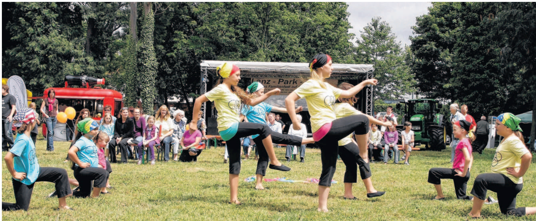
Auch zahlreiche Lindenhöfer Vereine werden bei der fünften Auflage des Lanzparkfests wieder mitwirken.

Ihr Mediaberater für den Lindenhof: Michael Baudermann Tel. 06 21 / 392-1403 Fax 06 21 / 392-1205 E-Mail: mbaudermann@mamo.de