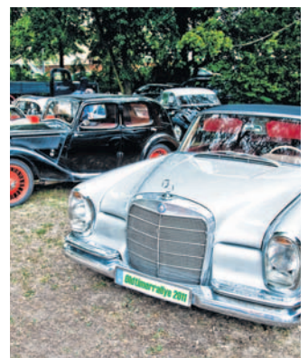
Über 40 Fahrzeuge nehmen an der Oldtimer-Rallye teil.