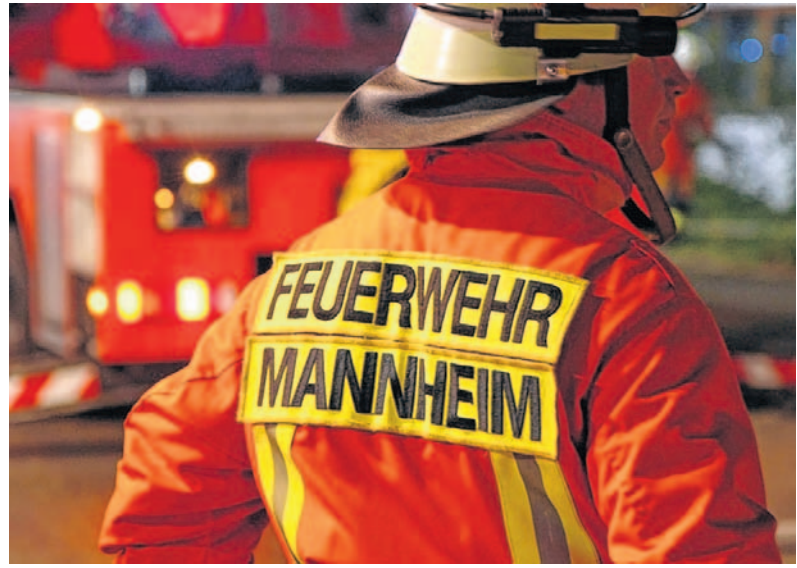
Mannheimer Feuerwehrleute trafen sich im Saal des Großkraftwerks zum traditionellen „Fest der Feuerwehr“.