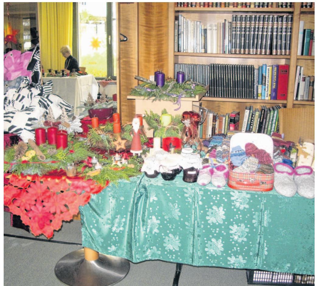
Kunsthandwerk und mehr findet sich im Stadtquartier Lanzgarten beim Adventsmarkt am 19. November

Adventsmarkt im Stadtquartier Lanzgarten, Samstag, 19. November, 11 bis 18 Uhr.