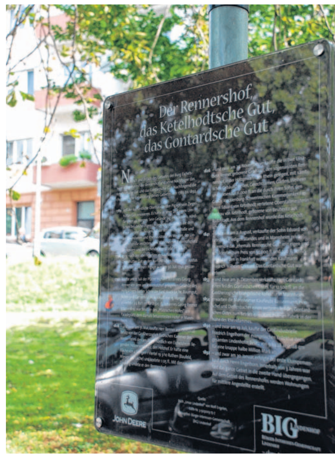
Die Infotafel zum Rennershof.

Nur elf Jahre später erwarb der Hotelier den nördlich von Eichelsheim gelegenen Holzreserveplatz, den Holzhof. Damit kam eine weitere Fläche von rund vier Morgen in seinen