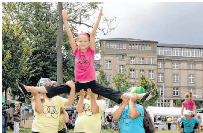
Das Konzept hinter dem Lanzparkfest ging voll auf.