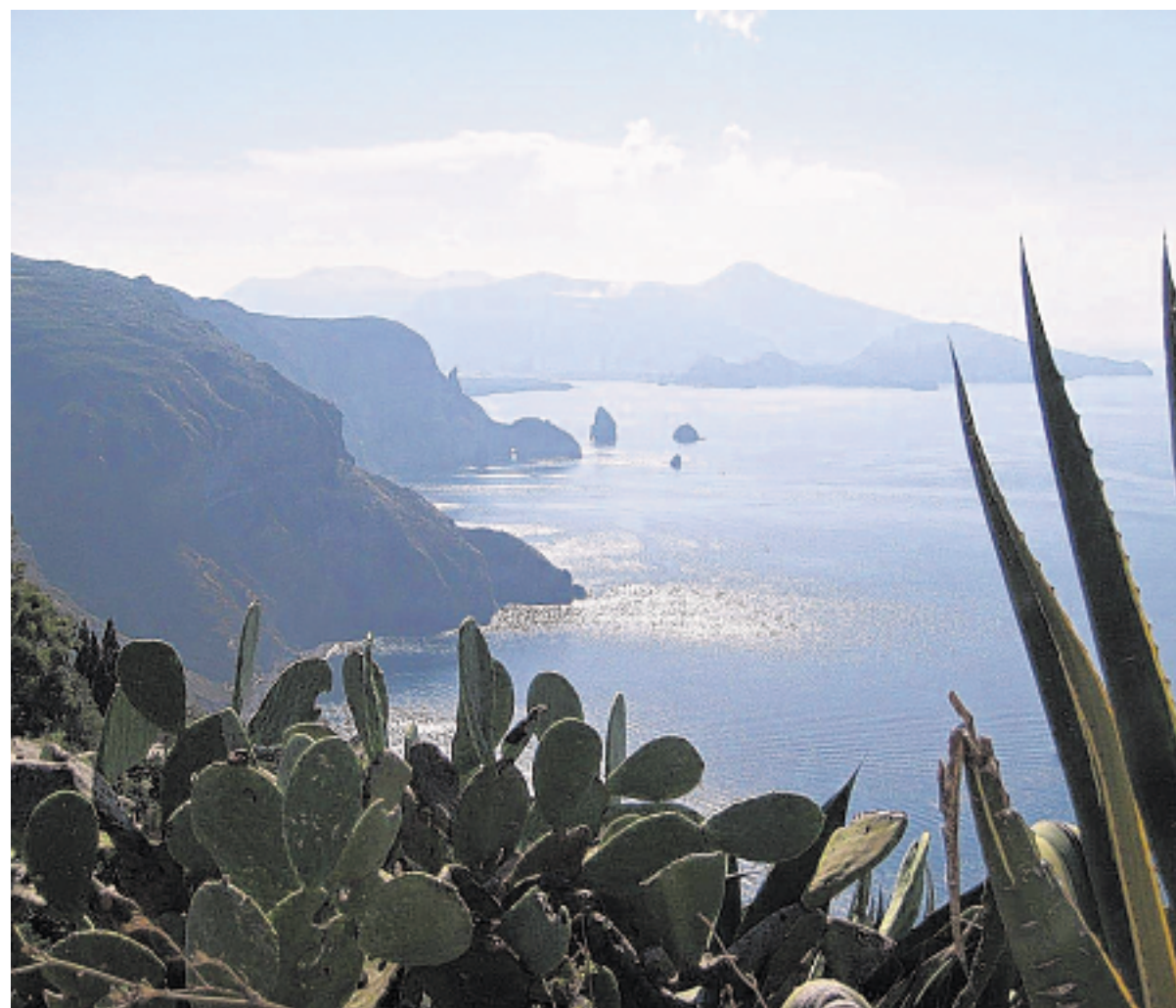
Wunderschöne Buchten und eine faszinierende Landschaft bieten sich dem Besucher auf Sizilien.