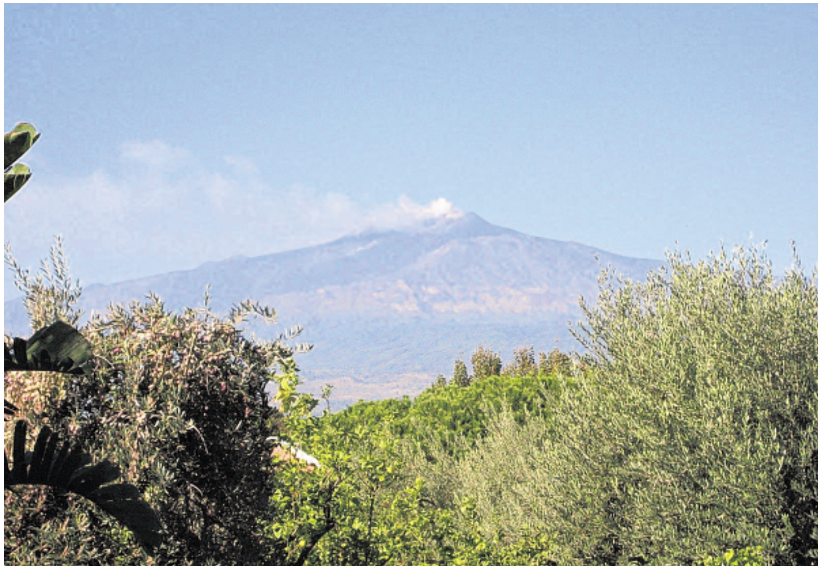
Sizilien wird vom Ätna beherrscht. Der Vulkan zieht nicht nur die vielen Touristen aus aller Welt in ihren Bann, sondern lockt auch die Einheimischen, gerade nach den nächtlichen Lavaausstößen.

Im Griechischen Theater spiegelt sich die Kunst der Griechen aus der Zeit der Hochklassik wieder. Aus einem Fels herausgeschlagen wurde das gesamte Auditorium. Der Baumeister sprach die Sätze: „Im Stein