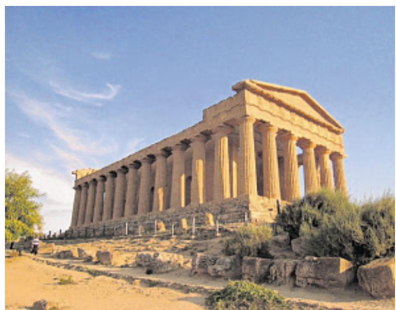
Die griechischen Tempelruinen auf Sizilien beeindruckten die Besucher der Leserreise der Fränkischen Nachrichten.