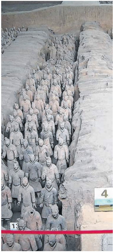
Die Terrakotta-Armee beeindruckte.

Während die Alten tanzen, arbeiten die Jungen an der Zukunft. In Shanghai heißt sie EXPO 2010. Bis dahin soll viel geschehen. Man wunder sich schon lange nicht mehr.