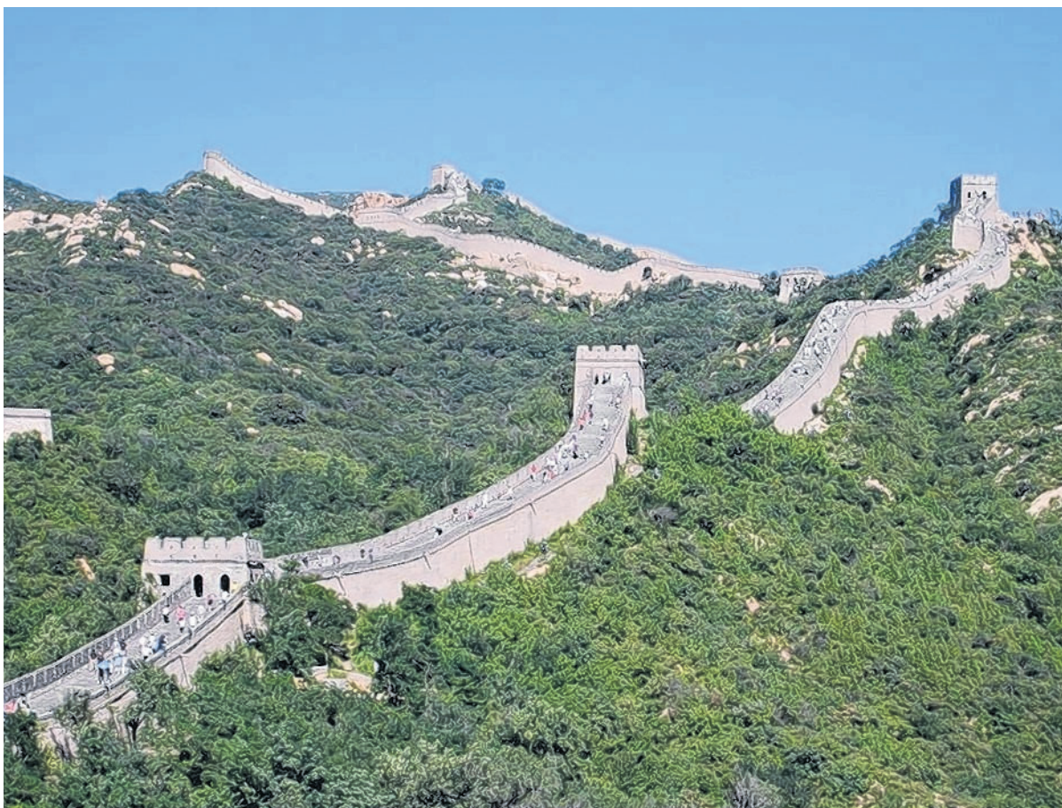
Der Besuch der chinesischen Mauer durfte beim Programm der Leserreise nach China nicht fehlen und hinterließ ganz besondere Eindrücke.