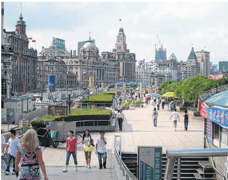
Historisches und Modernes trifft in Shanghai, wie hier am „Bund“, einer stimmungsvollen Uferstraße, aufeinander.