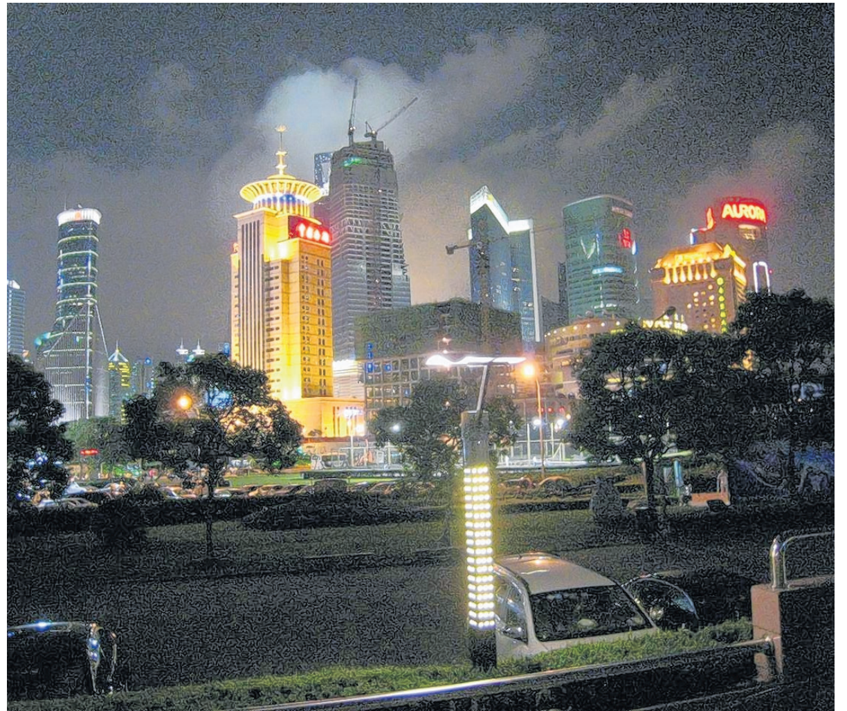
China präsentiert sich dem Besucher herausgeputzt. Shanghai, die große Metropole Chinas, faszinierte die Teilnehmer der Leserreise bei Tag und vor allen Dingen bei Nacht.

Wie man eine solche Mauer bauen kann, darüber wundert sich von der Gruppe niemand mehr, nachdem man die neuesten Bautätigkei-