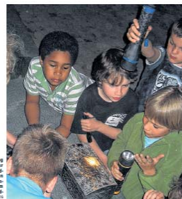
Auf Tuchfühlung mit Schlangen und Co! Ein Abenteuer für Kinder im Reptilium Landau.

Mitbringen sind Luftmatratze, Schlafsack und gute Laune. Anmeldechluss ist der 30. September. Die Mindestteilnehmerzahl liegt bei zehn Kindern.